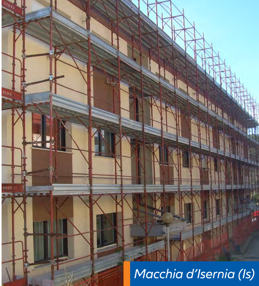
Macchia d'Isernia (Is)